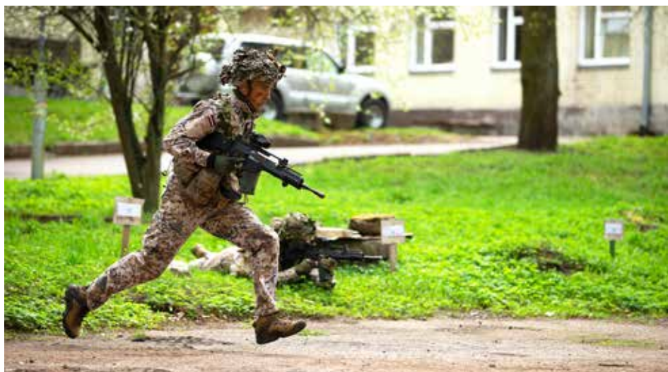
Atvērto durvju diena NAA, kadets taktiskā uzdevuma paraugdemonstrējumā. 2018. gada 3. maijs

Es pati arī pirms iestāšanās NAA apmeklēju Atvērto durvju dienu, kā arī Ēnu dienu kopā ar divām meitenēm, kuras, tāpat kā es, iestājās NAA. Tāpēc šo pasākumu rīkošana ir ļoti svarīga, lai pārliecinātu cilvēku, ja nu tomēr viņš vēl šaubās, izdarīt pareizo izvēli. Domāju, ka daudziem ir bail tieši no fiziskās slodzes un dzīvošanas mežos, parunājot ar kadeti, viss nesaprašanās tiek izskaidrots.”