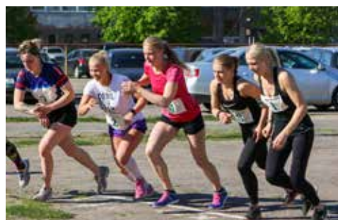
NAA Rektora kauss. 2018. gada 11. maijs