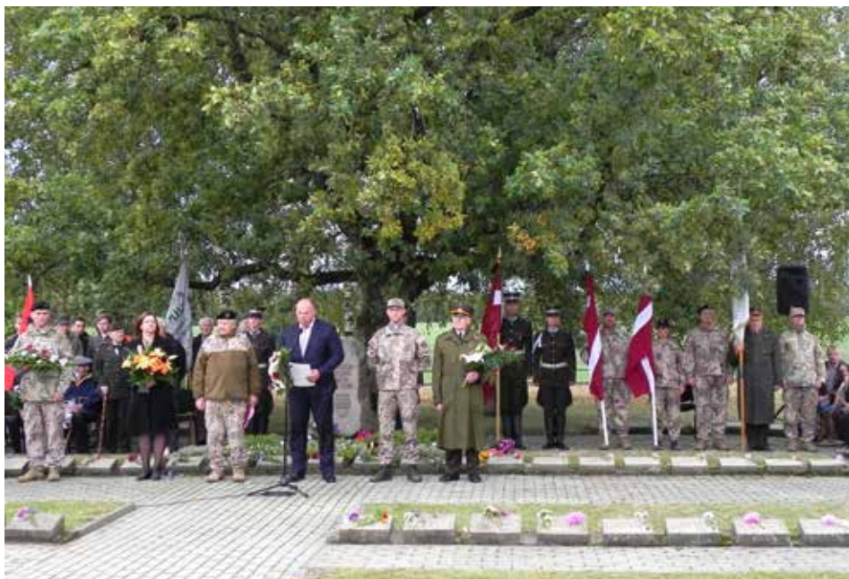
Svētbrīdis latviešu leģionāru Brāļu kapos pie Roznēnu ozola. Klātesošos uzrunā aizsardzības ministrs Raimonds Bergmanis, viņam blakus NBS, ZS, Siguldas pašvaldības un LVA pārstāvji. 2018. gada 22. septembris