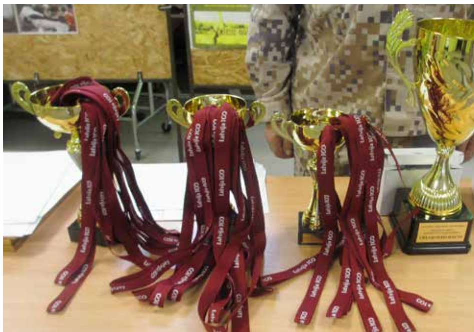
LVA sarūpētās medaļas un LVA Cejojošais kauss pirms komandu un dalībnieku apbalvošanas militarizētajās sporta spēlēs Kuldīgā, Zemessardzes 45. NBN bataljonā. 2018. gada 28. septembris