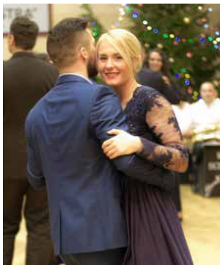
NAA Ziemassvētku balle. 2017. gada 15. decembris