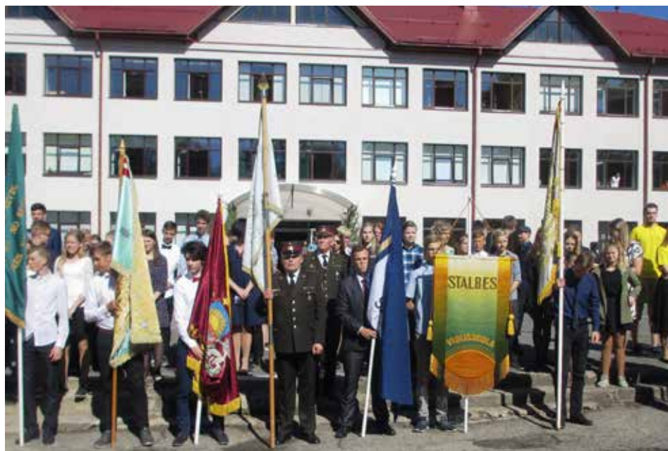
Skolnieku rotas karoga maiņas ceremonija Rūjienā. Ar devīzi "Augstu celt, godam nest!" Rūjienas vidusskola nodeva karogu glabāšanā 2018./2019. mācību gadā Mazsalacas vidusskolai. 2018. gada 17. maijs