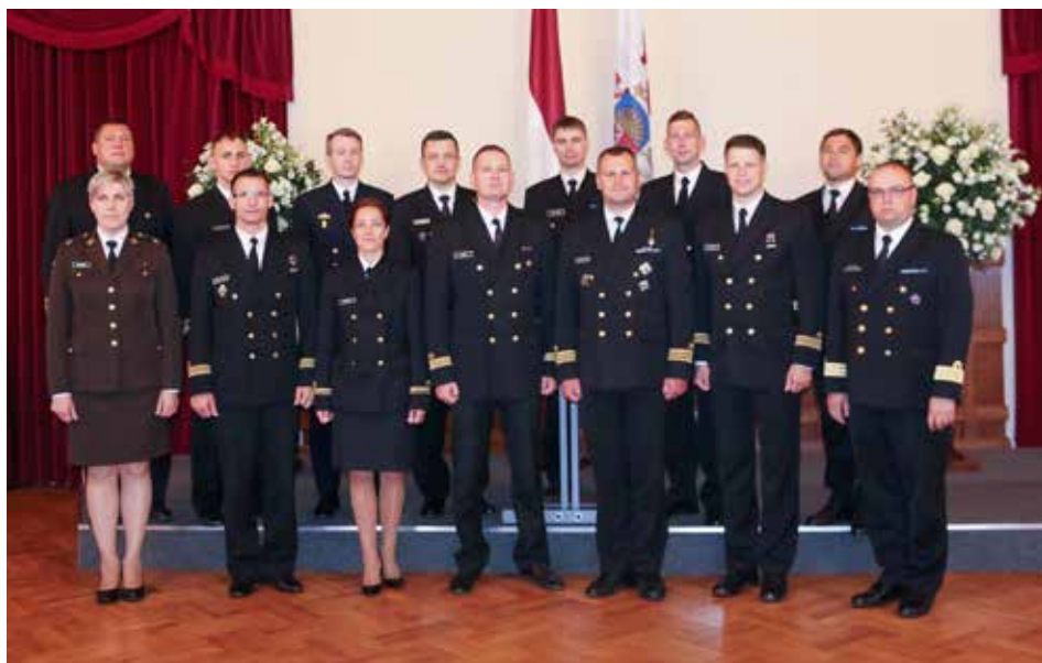
JS VLŠVK Valsts prezidenta piļi. 2018. gada 14. jūnijs

Vienlaikus vēlos izteikt pateicību NAA vadībai par atbalstu un izpratni ikdienas dienestā. Tikai savstarpēji mijiedarbojoties, tiek panākta uzticēšanās un iespēja tikties un sasniegt aizvien augstākus mērķus!