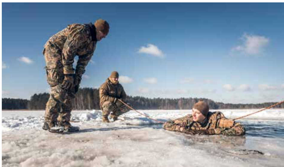
Štāba bataljona izdzīvošanas kurss (lēkšana āliņģī). 2017. gada 19. decembris

Tā disciplinārā vara, kas tev ir dota, principā neko neietekmē, piemēram, rājiens ar ierakstu nozīmē, ka sodītais kādu pusgadu nesaņem motivējošās piemaksas. Tas ir viss, un karavīri izmanto robus sistēmā. Piemēram, fiktīvi slimo. Patiesībā tas ir ļoti skumji. Mēs jau redzam tos jauniešus, kas šādi spekulē. Bet rokas ir sasietas tajā ziņā, ka mums nav to karavīru. Ja saīdžina, kāds bija stāvoklis, kad es sāku dienestu bruņotajos spēkos –