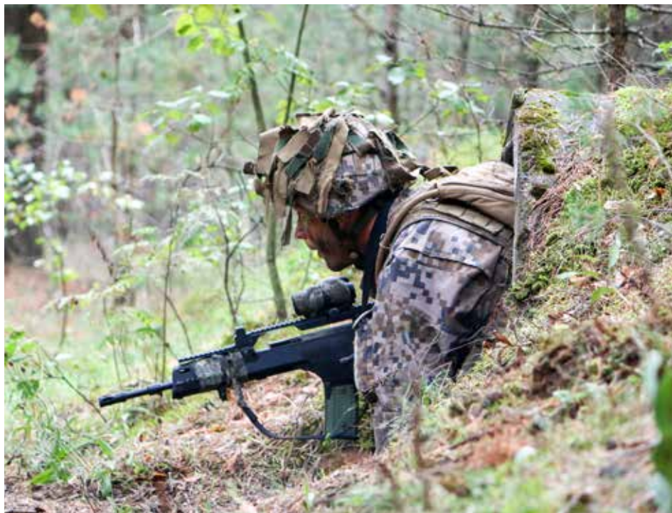
Taktikas kauss. 2018. gada 20. augusts