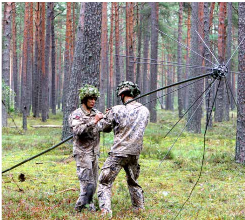
Taktikas kauss. 2018. gada 20. augusts

Nometnes noslēdzās ar pirts kurināšanu un šašliku ēšanu. Neoficiālā gaisotnē kadeti stāsta interesantus, smieklīgus un grūtus notikumus, kas tika piedzīvoti nometnes laikā. To pašu dara arī instruktori. Protams, nevar aizmirst par tām naktīm, kad paliec ārā poligonā, pildot konkrētu uzdevumu, bet, gulēt ejot, izbaudi dabas klusumu un skaistas zvaigžņotas debesis.