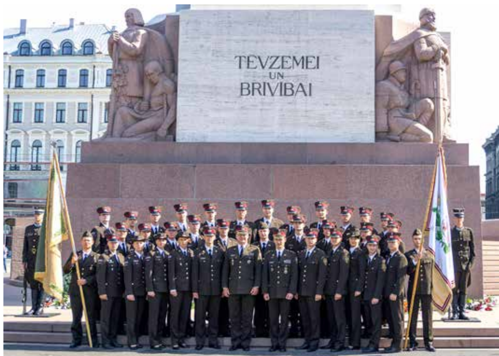
NAA izlaidums. 2018. gada 15. jūnijs