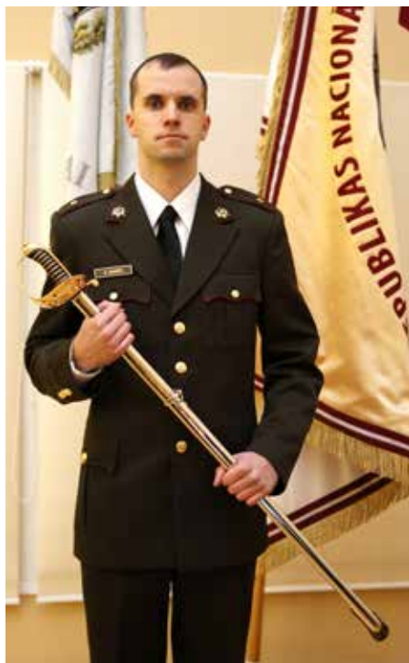
Melnās kafijas vakars .2015. gada 30. novembris

– Jā, tas trūkstošais punktiņš tagad neskaitījās, jo, ja karavīrs nāk no profesionālā dienesta, ar viņu nav jāauklējas. Viņš zina kārtību, zina, kāda ir karavīra maizīte. Pēc Cēsu instruktoru skolas jau biju akadēmijā. Sākumā bija grūti pielāgoties, tā kā biju dienējis, jutos tāds kā pārāks par citiem, lielība, protams. Tāpēc sākumā attiecības ar kursa biedriem nebija tās labākās, bet beigu beigās sapratām, ka visi darām vienu un to pašu darbu, un ar visiem kursa biedriem attiecības bija ļoti labas. Tādas tās ir vēl šodien. Civilās zināšanas apguvām RTU.