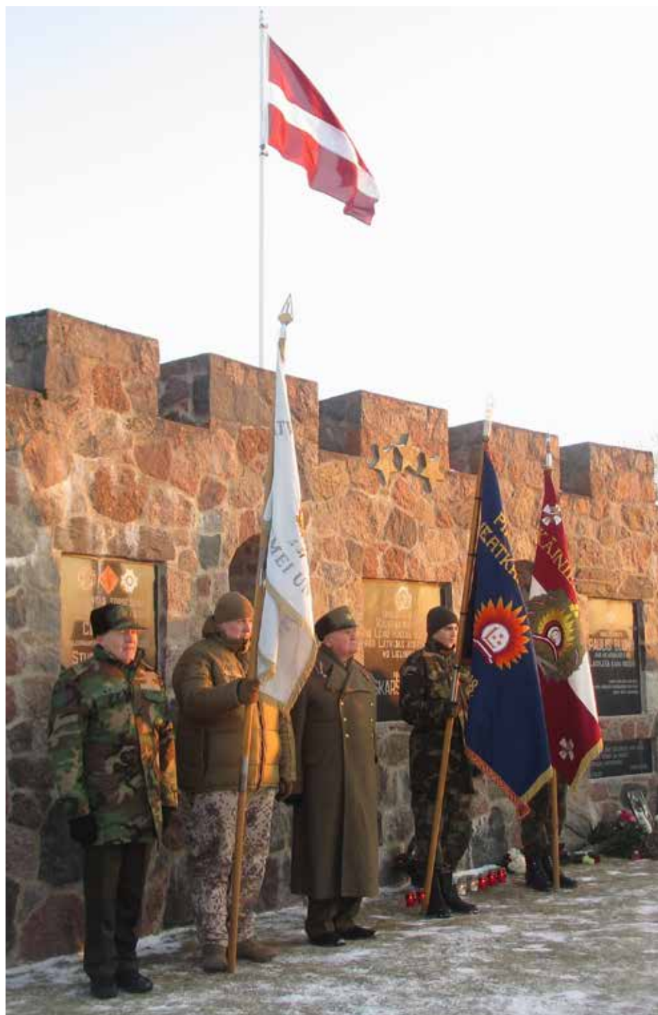
Lēnas, jaunsargu pasākums Kalpaka ceļš. 2018. gada 3. marts