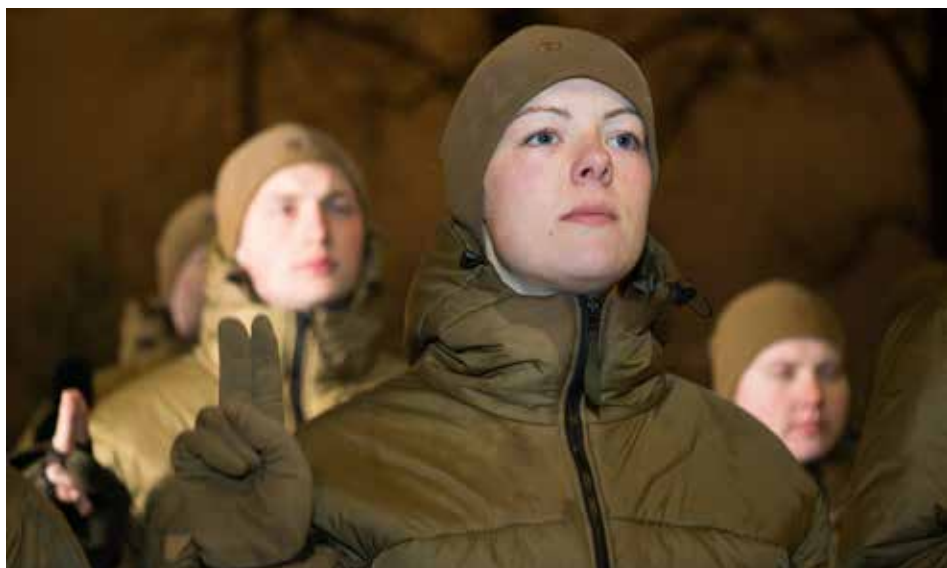
Kadete svinīgā kadeta solījuma laikā

“Visi zināja, kas naktī notiks, tāpēc mierīgi gulēju. Atnāks, uzbļaus, un viss. Tāpēc ložmetēja kāрта nakts klusumā nāca pilnīgi negaidīti, un pārsteigumā gandrīz izkritu no gultas. Lai gan lielākā daļa aktivitāšu patika, tomēr teātris ar āliņģi gan bija neefektīvs. Jūras spēku stāvs ar savu sirēnu deva nedaudz trūkstošo saspringumu, un barikādes mūsu stāvā arī radīja ļoti krāsainas emocijas. Vakara odziņa tomēr bija Krīvu rūgtais. Tik traku es nebiju gaidījis.”