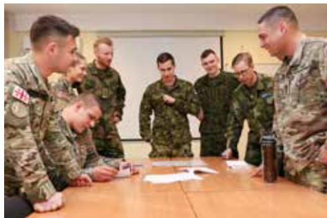
Starptautiskā kadetu nedēļa Latvijā, NAA. 2018. gada 12. marts

Otrās dienas vakars noslēdzās Liepājā ar kopīgām vakariņām vecpilsētā. Nākamajā dienā kadeti devās uz Baltijas valstu Jūras spēku ūdenslīdēju skolu, kur iepazīnās ar ūdenslīdēju ikdienas dzīvi un ekipējumu. Tālāk ekskursija turpinājās Karostas cietumā, kā arī Ziemeļu fortos, kur notika Brīvības cīņas.