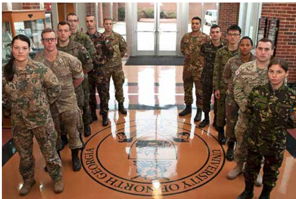
Kadetu starptautiskās nedēļas ASV dalībnieki. 2017. gada 4.-11. novembris

Starptautiskā kadetu nedēļa kopumā bija ļoti labi organizēta, saturīga un ar interesantām aktivitātēm ne tikai no atpūtas un kultūras iepazīšanas aspekta, bet arī akadēmiskajā jomā.