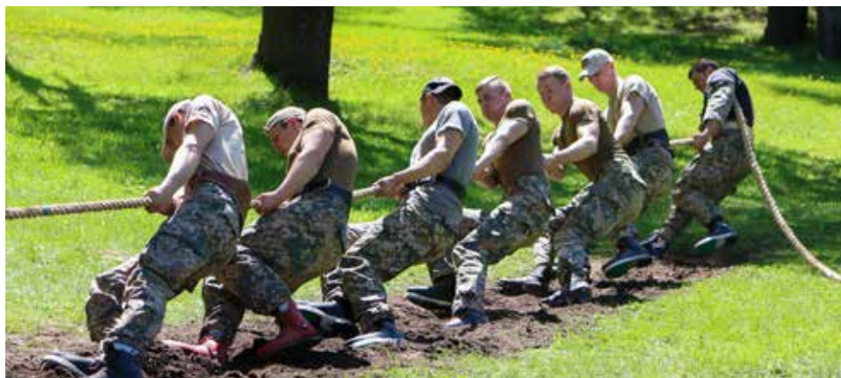
NAA Rektora kauss. 2018. gada 11. maijs

Šī gada 11. maijā norisinājās arī Latvijas Nacionālās aizsardzības akadēmijas Rektora kausa 2018 izcīņa. Dalībnieku vidū bija ne tikai kadeti, bet arī akadēmijas personāls. Cīņa par Rektora kausu notika vairākās disciplīnās. Pēc kadetu iniciatīvas šogad jaunums bija tautas bumba un šaušana ar Glock17 , pneimatiskās šaušanas vietā.