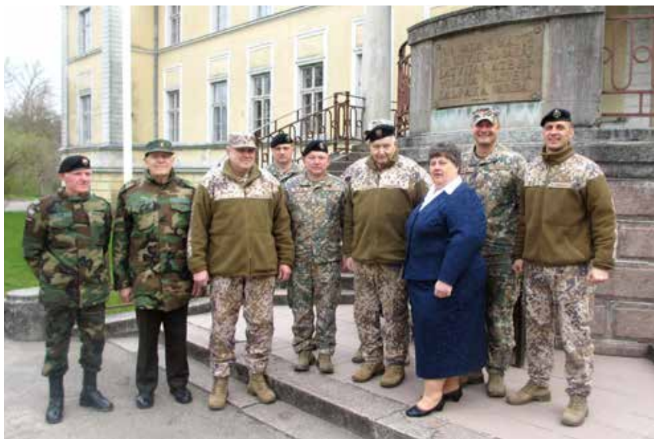
Lielā talka Rudbārži-Kalpaka ceļš-Skrundas kara pilsētiņa. 2018. gada 28. aprīlis