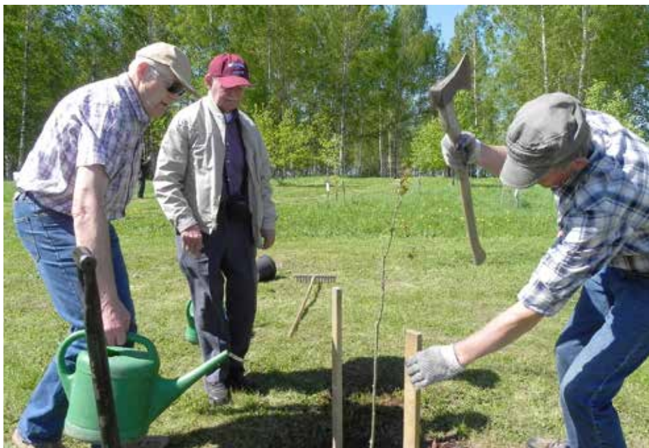
Likteņdārzā, iestādot astoņus ozoliņus mirušo LVA biedru piemiņai. 2018. gada 10. maijs