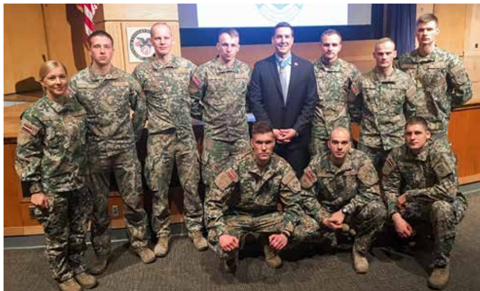
NAA komanda militārajās sacensībās ASV. 2018. gada 9. aprīlis

Pēc īsas atpūtas komandas tika aicinātas uz svētku vakariņām un rezultātu paziņošanu akadēmijas ēdnīcā. Pēc vadības uzrunām, kā pirmās uz apbalvošanu tika izsauktas