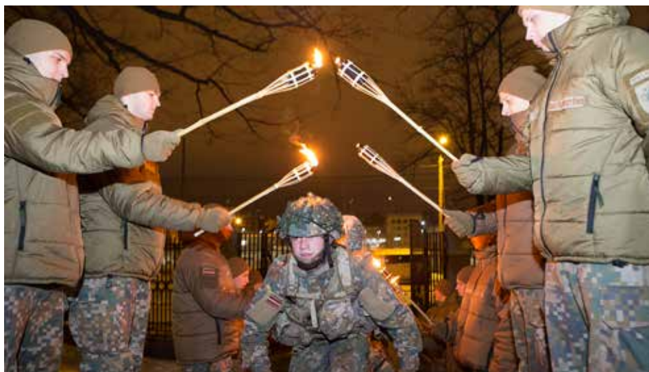
NAA Baltā nakts , kadeti dodas pie bijušās Latvijas Kara skolas dot kadeta svinīgo solījumu. 2018. gada 2. marts

4. stāvā staciju veido Gaisa spēku kursi, kur jaunos gaida helihoptera simulators, aviācijas tehnikas erudīcijas spēle un sakaru procedūras.