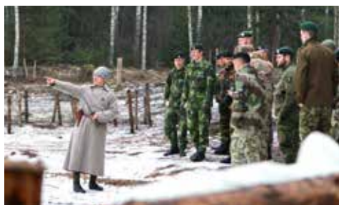
Starptautiskā kadetu nedēļa Latvijā, Ziemassvētku kauju muzejā. 2018. gada 13. marts