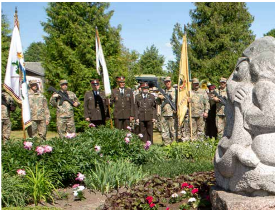
Gulbene-Litene, godinot komunistiskā terora upurus. 2018. gada 14. jūnijs