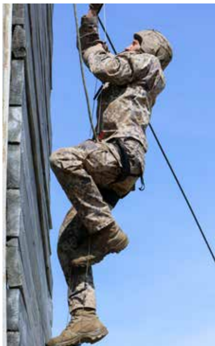
Kadets uzdevuma izpildē vēsturiskā pasākuma laikā

Bāzē mūs iepazīstināja ar turpmākajiem dienas uzdevumiem. Pirmais uzdevums bija vertikālo šķēršļu pārvarēšana, izmantojot alpinisma ekipējumu. Šķērslis bija 12 metru augsts tornis, no kura nācās laisties lejā ar virvi. Otrais pārbaudījums bija izkļūšana cauri šaurām vietām. Mums nācās līst cauri astoņu metru garai caurulei, kas veda cauri pauguram.