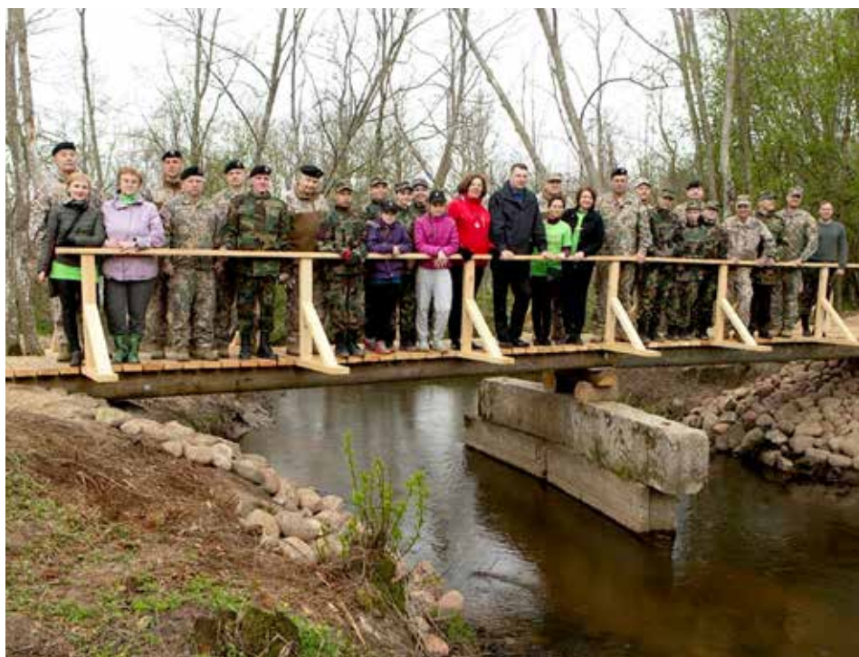
Lielā talka, atjaunotais tiltiņš pār Kojas upīti. 2018. gada 28. aprīlis