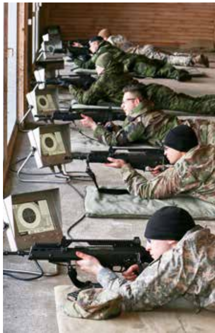
Starptautiskā kadetu nedēļa Latvijā, kaujas šaušana Kadagā. 2018. gada 15. marts